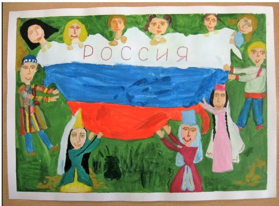
Рисунок для солдата от детей в поддержку наших Защитников Отечества. Рисунок за Россию! Дети рисуют мир, дружбу, счастье, любовь...