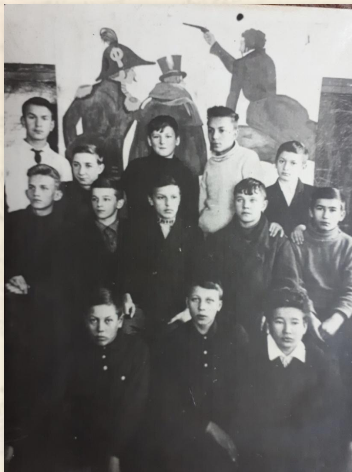
(третий ряд – в центре)